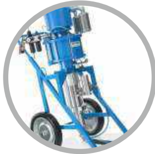
Μηχανήματα Βαφής Airless - Αέρος