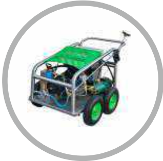
Μηχανήματα Υδροβολής από 200 bar έως 3.000 bar