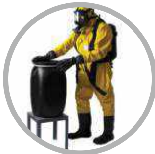
Μέσα προστασίας εργαζομένων