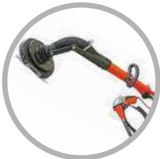
Μηχανήματα επεξεργασίας επιφανειών