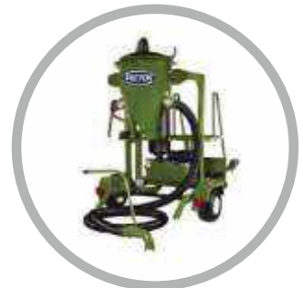
Μηχανήματα Απορρόφησης Υγρών – Στερεών υλικών