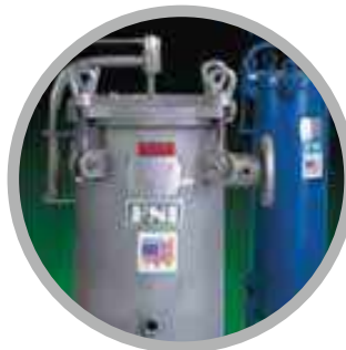
Μηχανήματα Φίλτρασης Υγρών